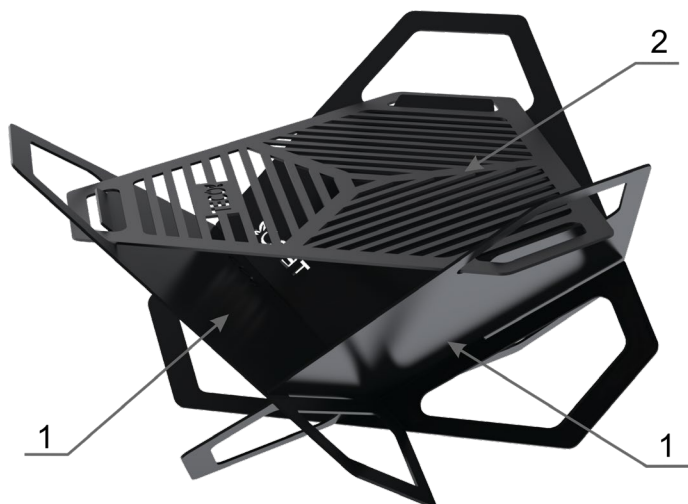
Рис. 1 Устройство костровой чаши - гриль 1 – стенки костровой чаши; 2 – решетка гриль.

Костровая чаша - гриль — это разборная костровая чаша, изготовленная из конструкционной стали толщиной 3 мм .